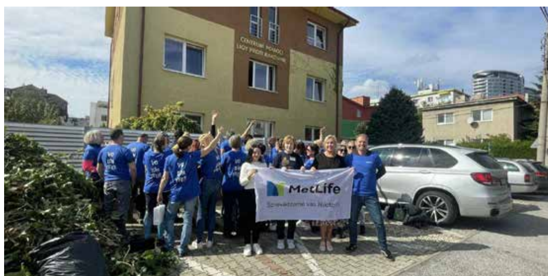
Dobrovoľníci MetLife zvelaďovali sídlo občianskeho združenia Liga proti rakovine v Bratislave.

MetLife pôsobí na Slovensku od roku 1995, poskytuje široké spektrum produktov životného a úrazového poistenia a stala sa synonymom finančnej istoty a profesionalizmu. Community day bol súčasťou celosvetového projektu Dobrovoľníctvo s cieľom (Volunteering with purpose), ktorý prebiehal na globálnej úrovni v priebehu augusta a septembra. „Napriek tomu, že sa organizáciami spolupracujeme už niekoľko rokov, je to zatiaľ najväčšia akcia venovaná dobrovoľníctvu.“ (KSE)