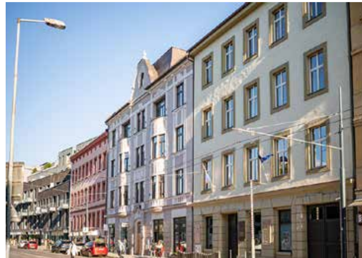
Bratislavské bábkové divadlo po desaťročnej rekonštrukcii.