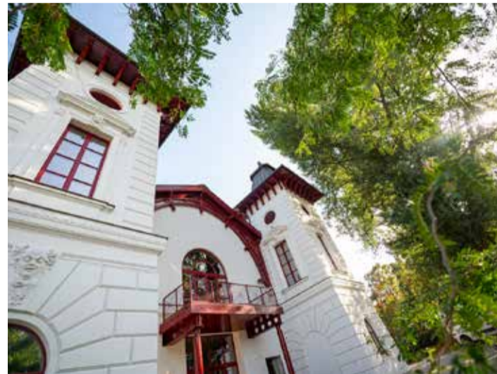
Divadlo Aréna na petržalskej strane Dunaja v plnej kráse po obnove.