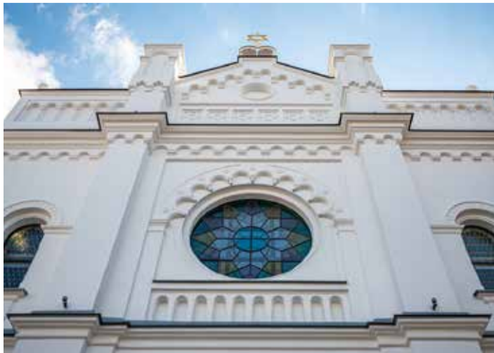
Synagóga v Senci po komplexnej rekonštrukcii.