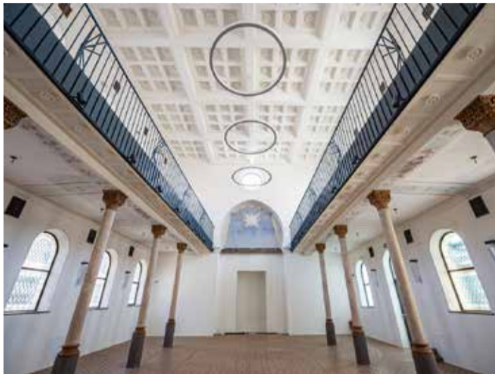
Interiér seneckej synagógy po rekonštrukcii.